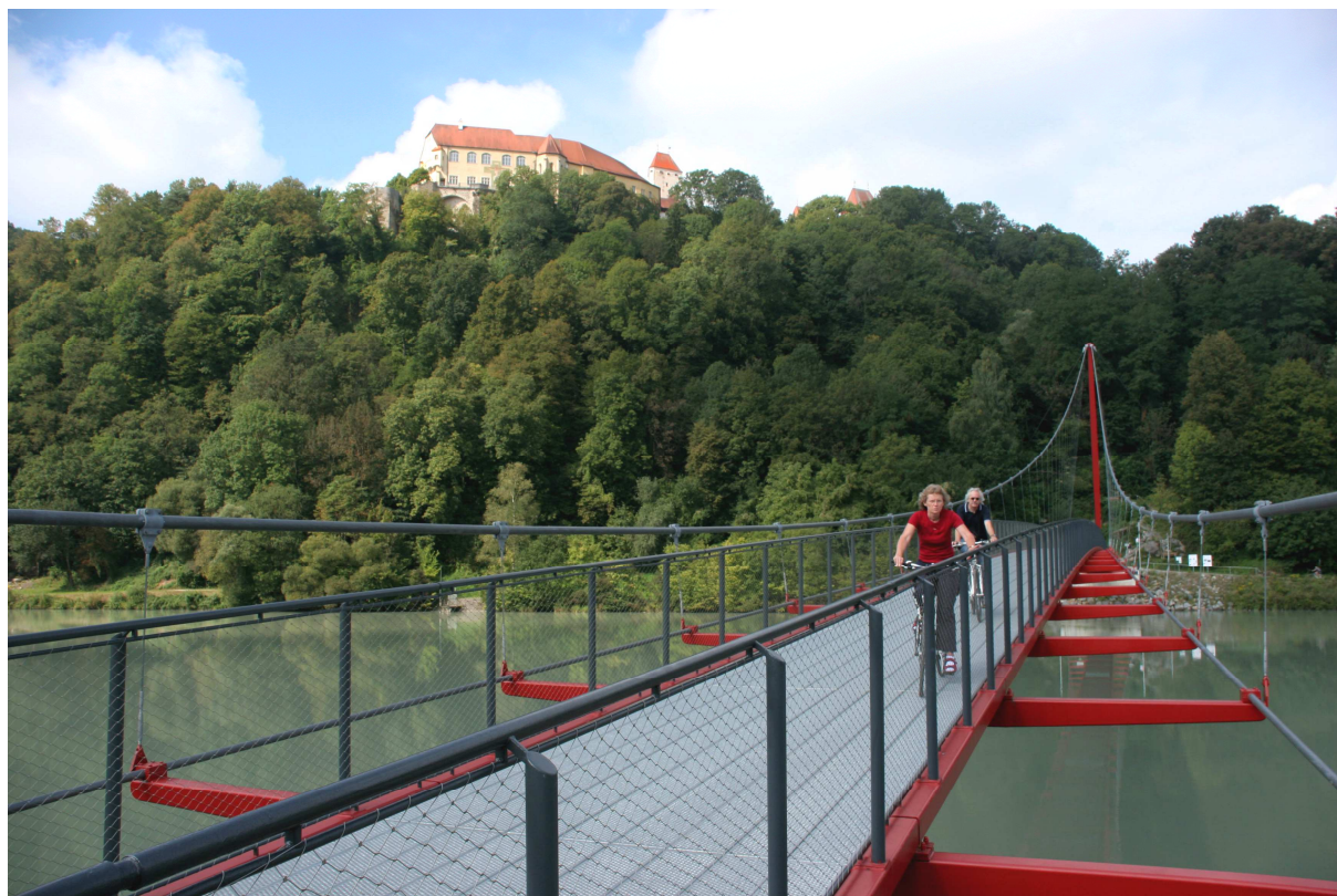
Wernstein/Neuburg Fußgängerbrücke über den Inn

In Fürstdohl (8,290 km) bietet sich hingegen eine reizvolle Weiterung dieser Wegstrecke an, die jedoch insgesamt um etwa 7 km länger ist. Wenn wir von hier aus geradewegs weiterfahren, erreichen wir die Bundesstraße 12 (Km: 9,910) vor Dommelstadl/Neuburg a. Inn. Sowohl die Kirche in Dommelstadl (11,300 km) wie auch die Burg in Neuburg (12,200 km) oder ein Gasthaus laden zum Verweilen ein. Eine besondere Attraktion ist allerdings die Abfahrt an der Burg vorbei hinunter zum Inn und von dort nach rechts bis zur Marienbrücke (13,400 km) über den Inn nach Wernstein. Dieses Ziel anzusteuern lohnt sich allemal, weil man von der österreichischen Flussseite einen eindrucksvollen Blick auf die hoch über dem Inn thronende Neuburg hat.