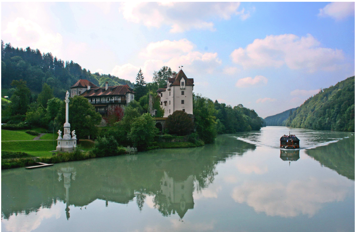
Neuburg – Wernstein Blick von der Marienbrücke innaufwärts

An besonders heißen Tagen empfiehlt es sich vielleicht, in Ingling das Stauwerk nur durch einen Abstecher auf das österreichische Ufer hinüber zu erkunden und dann auf bayerischer Seite weiter innaufwärts zu fahren, weil hier der Weg zumeist am schattigeren Waldrand bzw. Innufer verläuft. Sobald man jedoch beim Flusskilometer 10.0 einen kleinen Parkplatz unterhalb von Neuburg erreicht, sollte man nicht versäumen, die weiteren 200 Meter bis zur Marienbrücke und hinüber nach Wernstein zurückzulegen.