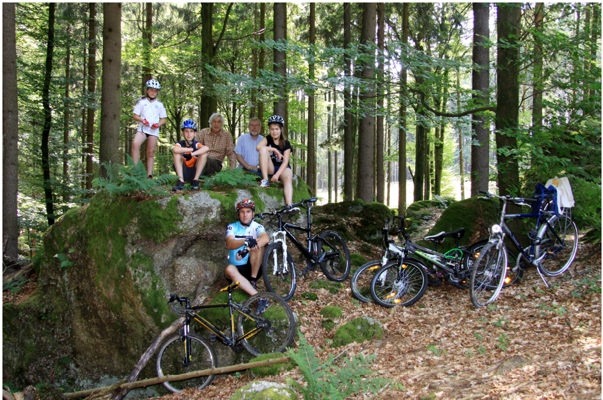
Im Felsengarten bei St. Salvator

Da das Abschiednehmen erfahrungsgemäß schwer fällt und möglichst hinaus geschoben werden soll, empfiehlt es sich, für eine reichliche Verpflegung Vorsorge zu treffen.